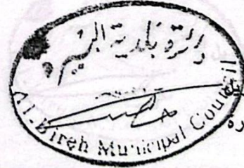
حسان مصطفى الطويل رئيس بلدية البيرة