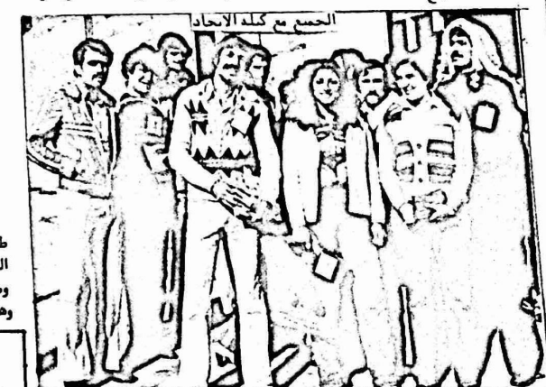
الجمع مع كتلة الاتحاد

طلبة الدائرة بما في ذلك نوعية الكتب وطريقة ولغة التدريس وموضوع الامتحان العام Comprehension برسالة وهناك اقتراح لاستبداله برسالة