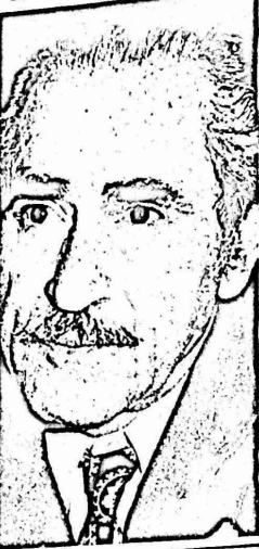
بقلم د. اميل توما

ومن يعود الى الصحافة الاسرائيلية في تلك الايام استطع ان يكشف مدى غضب حكام اسرائيل وقادة المنطقة الصهيونية العالمية على الولايات المتحدة لانها اعترفت بوجود الشعب العربي الفلسطيني.. x ولم يمر حرب تشرين الاول (اكتوبر) 1973 الشرق اوسطية من هذا الاتجاه على الرغم من آمال غلاة الامريكيين والرجعيين في سف عملة الانفراج والرجعيين في وهكذا في لقاء القمم الثالث (برجسيف - فورد) في فلاديفوستوك (الاتحاد السوفيتي) ثم الاتفاق بين الطرفين - كما جاء في سانها المشترك (24 تشرين الثاني 1974) "على بذل جميع الجهود للمساعدة على حل القضايا الاساسية المرئطة باقامة سلام عادل ووطيد في هذه المنطقة على اساس قرار مجلس الامن 242.. وذلك باخذ المصالح المشروعة لجميع شعوب هذه المنطقة بما في ذلك الشعب الفلسطيني بعين الاعتبار واحترام حق كافة دول المنطقة في الكيان المستقل.."