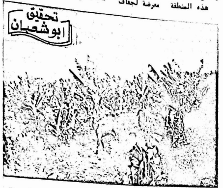
تحقيق ابو شحيان

عامه ، يساهم فيها جميع المزارعين الا ان الحاكم العسكري العام ، وعد رئيس بلدية اريحا والمزارعين بان يقوم بجولة مع رئيس البلدية في العوجا ، لكن هذا الوعد لم يتحقق بعد ، وما زالت شكايات مياه الشرب تتعلل الهاله الى العوجا ، فقط لنظفنا طما الالهالي من الطفان وسا ، وشيوخ جرتومة الجفاف الى التويعة والديوك . مياه هذه المنطقة تعاني مياه عين السطلان التي تزود اريحا ، فمياه التويعة والديوك (من عين التويعة وعين الديوك) ، وتزود 2500 دونم مزروعة بالخضروات والحضبات وسائتي العوز ، ليعاني منها 2000-2500 نسمة هذه المنطقة معرضة لجفاف