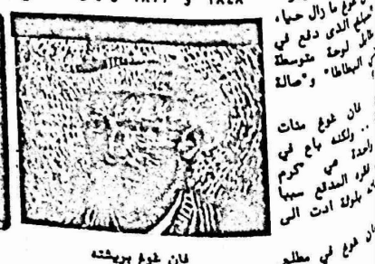
لوحة - اكلو البطاطا لفنان غوغ