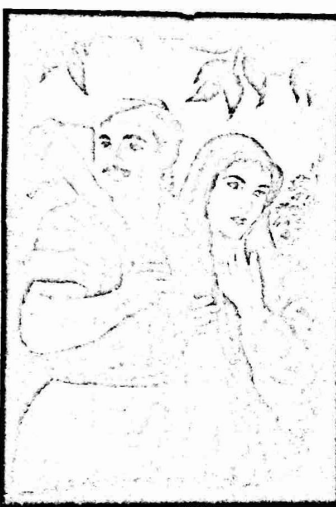
لوحة محمد حمودة