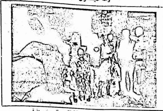
سلطات الاحتلال الامة تغلف بمائلة الكمي الى مخيم عفتة حبر المحور وتحكم عليها بالاشهر مجددا ..