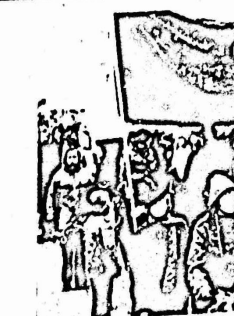
لتهه يعيل نضال الشبيبة من اجل عمل والعمية من غيرهم ، بالاستقرار والرفاه . فهل تعصي الامور على هذا النحو بالنسبة للالمان القريسين ؟