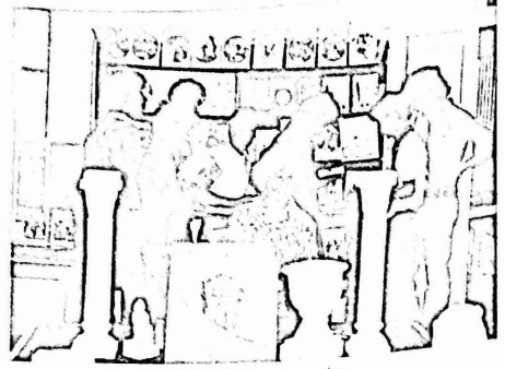
حاج من معرض كتب الاطفال

سجل التطور المعماري في مدن الضفة وفراها بالخاصي المنحوت حيث كان الاقتصاد الريائي - الانطوائى شكل اساسي معناه الكبح وقد تكففت الممارس المنحوت بالحجر والكلس والبراب والطين .. مع طقس البحر الميوط والبرغفان والحلجة والاعوار .. وادمتحت سوت السكان وساكب مع السكل الجارحي للاراضى واصبحت وكاتها حزا من العالم الطمعي .. وسكن الاجناس بالبلاد بفضوة المرشدة بالطمع . في الاجناس القديسة ست لحم والحليل في البلد وبالس .. حيث سكرز الاواي والحوامع والحباب .