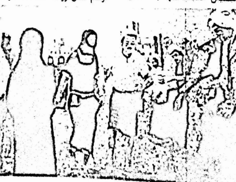
بديعه للرسام سالم جلمسان