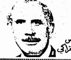
الرئيس محمد تراكي

كابول - اصدر المجلس الثوري لجمهورية افغانستان قرارا يباشر بموجبه تحقيق الاصلاح الزراعي في البلاد. وفي خطاب امام المجلس اعلن رئيسه نور محمد تراكي، رئيس الوزراء