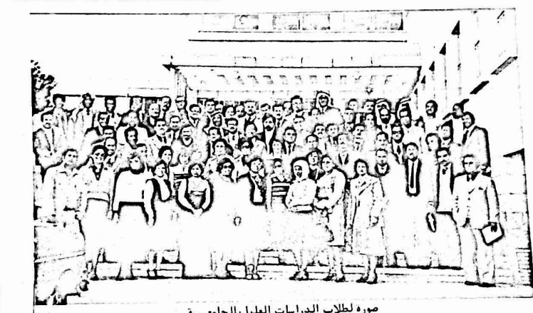
صورة لطلاب الدراسات العليا بالجامعة