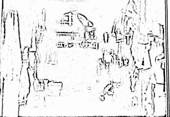
سوق خان الزيت - شارع مغلق

كناج تجاري قابل يتاز منه بالدرجه الاولى ٢٠٠ من اصحاب المحال التجارية في خان الزيت مع عائلاتهم .