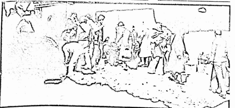
المعانة من الحفريات في باب العمود

ذلك . . . كما سئال المواطنين لماذا احارت فرسه الدحل وباصي الدوائر الضرسه هذا الوت بالذات لتتديد حمله الجاهه . . . . . وبوجهه الانذارات الباربه الفاضه بالدفع او الحجز . . . . . وبلاحظ التجار ان العرفه التجاريه العرسه قد اكفت بارسال مذكرة احتجاج حول هذه الاوضاع في الوت الذي هي مطالبه فيه بالايضا . بجمع التزاماتها والقام بالمواجب