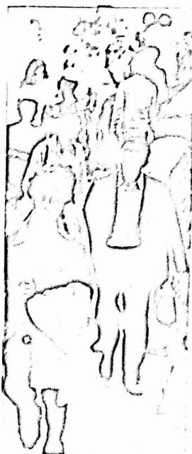
عقبه التكية تحول الى شارع رئيسي

فينا باغناطين من الصرائف في الفترة الخاسه وحسب اعاده الامور الى مجراها الصحيح . ونى كليا الحائس لم يلق الجار اي رد . وسؤال المواطنين والحال كذلك عن التاجر المصعد في اصلاح الاضرار في الممارل المصعده والايله للسوط . . . . وما هو العرض من وراء