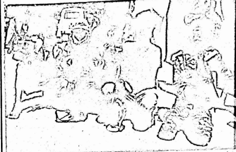
نوار جبهة فروليا في شوارع العاصمة

ستوط مالوم وحيزي ساد غناب الدعم الفرنسي ليتها . وارا . هذا النوع الذي احسن به الرخلات حاول كل منهما عبر مركزه في السلة فاضطه . ولكن فرنسا رفضت التدخل لتالاح اي ميثا ولكنيا صعب في نفس الوقت الجنرال مالوم من اسخدام الحسن السالدي ضد حسن حيزي المسمى حسن السال الصلح وتعدده الف رجل . وليندا استطاعت قوات حيزي ان تحل معظم العاصمة اما . الفعالم زعم ايها لم سجاوير الالف رجل مقابل ١١ الف جندي و ٣ الف ارفي سرتي . محتمون من الساحة الدستورية للجنرال مالوم . ولكنهم في الحشد ما سريون باوامر الجنرال "نورسد" قائد القوات الفرنسية في ساد . وقد احدث فرنسا هذا النوع للحلول دون مضمه احد الفرنسي وذلك لنص وجودها معا في انه سويد مع فروليا . وبالتفعل اصبح الظرفان سملان بعضون لكل ميثا في مجلس الرئاسة المكون من مائة اشخاص . الامر الذي يعطي لفروليا سلا في المجلس . ولكن من السكر القول ان فرولسا قد اسيرت اسمارا جاحما في الصراع الذي بدأ قبل اربعة عشر عاما في ساد .