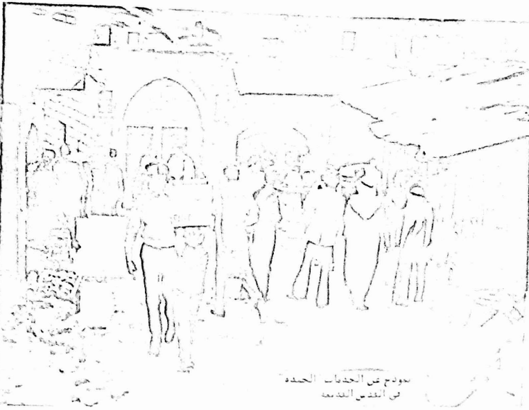
يؤدون عن الخدمات الجيده في القدس القديمه

وفي الاونة الاخيرة اساءت في سلطة القدس العربية حطت منطقتهم لحماية الضرائب وصيها ضريبة الحرف واليد. ضريبة المساحة وضريبة الاملاك. هذا بالاضافة الى انواع الضرائب الحكومية الاخرى مثل ضريبة الدخل و ١٢ / و ضريبة الارض وضريبة رأس المال، ورسوم اساسية والضرائب الاحترافية وحسب الارزاق التي اغشيتها النظام على أعمال الجماعه في البلديه. بلغ نسبة الضرائب التي تدفعها الدواشون العرب في السنة ٧٨/٧٧، ١٥ مليون ليرة اسرائيليه، وقد سيزيد سنوا في السنة القادمة زادت البلديه معه الضرائب بنسبه ٨٠٪. كما قررت زيادة ايامها للسنه الحاليه الحاليه والتي سميت في الشهر الجاري بنسبه سبواوح من ٧٠٪ و ١٠٪.