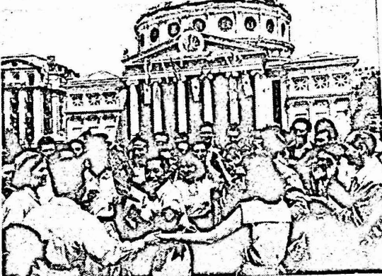
لقعة من المهرجان العالمي الرابع للشباب في بوغراست

وكم جاء في القرار الذي اتخذه المؤتمر الاول للحزب الشيوعي الكوبي في ان الشعب والشباب الكوبي سيؤدون واجبهم بشرف، وسيبدلون كل ما في وسعهم لكي يصبح المهرجان الحادي عشر نجاحاً جديداً للثورة الكوبية، وللشبيبة الثورية والتقدمية، وللطلاب في العالم الذين يشهدون تضامنه المعادي للامبريالية ويناضلون من اجل السلم والصدادة.