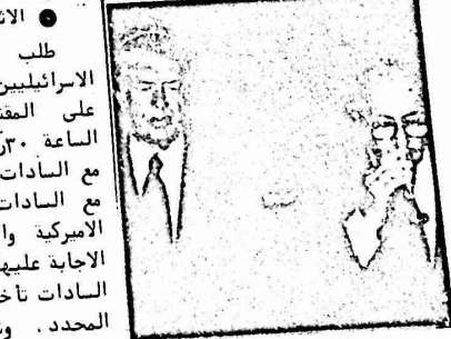
كارتر وبينغ بصليان ..

● الخميس ٢٧ ايلول ● استيقظ الطاقم الاميركي في الساعة ٧:٣٠ صباحا. واجرى