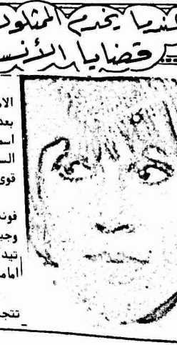
تتجه الى تمثيل الادوار الانسانية

عاشيا بحمد المثلون السيفايون قضايا الانسان العارلة عادت مؤخرا نجمة السينما الامريكية جين فوندا الى الشاشة بعد غياب ثلاثة اعوام، حيث افرتن اسمها في تلك الاعوام، بالقضايا السياسية معلنة تضامنها فيها مع كل قوى التحرر والتقدم العالمي. و اول فيلم ظهرت فيه جين فوندا بعد رجوعها هو (مرح مع ديك وجين) وهو فيلم كوميدى من اخراج تيدكوتش، ويقوم بدور البطولة امامها جورج سيغال. وكانت جين فوندا قد بدأت تتجه الى تمثيل الادوار الانسانية