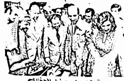
مشهد من حفل الافتتاح

الدوري، والمحمصه للاعداد والاغراس والمصوعه من امصه فاحره لقب اطار الزوار. وهناك ايضا المسرحيات المصوعه والسكلاات اصابه الى مروضات ورحرفه ورحاحه من الاواس والاياريق وحف حمله مصوعه من المحاسي او حبت الزبون او من المحار الطسمى اصابه الى الالات الموسيقيه واعمال من الفن.