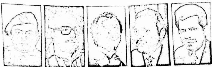
بعض أعضاء المكتب السياسي الجديد للحزب الاشتراكي وهم من اليمن إلى اليسار الأمين العام عبد الفلاح اسماعيل، علي ناصر محمد، محمد صالح مطيع، علي عبد الرزاق ياديب، وعلي أحمد ناصر عتير

المخلفه ووضع الحلول للعنسا الاجتماعيه والاقتصاديه والساحسيه والتعاقبيه. ويرتبط علمه ايضا بترسيخ اعضائه الى المناصب القادسيه في جهاز الدوله. وقاما بحسن تدوير الحزب في الاشراق واليوحه والرفايه تلعب المنظمات القاعدية دورا كبيرا في مرافده سر سناظله اجهزة الدوله وتنطبق سناة الحرب ولكن يجب الا يفهم من ذلك على الاطلاق استبدال الحرب بالدولة او العكس بالعكس.