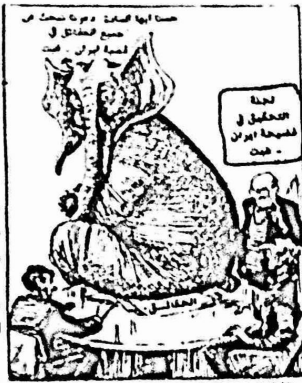
صاحبها صامت ومرت سحت من حسب فضائل في سيرة امرت صحت

ونتيجة كل ذلك تتحشد الآن ٢٤ سفينة حربية اميركية بقيادة حامله الطائرات "كيتي هوك" في منطقة "مطحة الجمال" التي تبعد ٥٠٠ ميل من الخليج وحيث مضيق هرمز واهداف اخرى مجاورة تقع ضمن مدى طائرات الحاملة وبما يكفل غامشا من الامان ضد هجوم تشنه طائرات او صواريخ من قواعد برية ضدها حسب "كريستشيان ساينس مونيتور" الاميركية. واوضح وزير الدفاع الاميركي ان هذا الوجود ضروري حتى تكون الولايات المتحدة قادرة على الاستجابة لطالبات المعونة التي قد تأتيها من الدول الصديقة التي ترى في الصواريخ الايرانية تهديدا. واوضح ان الوجود هذا ضروري حتى لو لم يفكر الايرانيون في اطلاق الصواريخ فانه يمكن "لقدرة ان تثير الرعب، فاما ان تحد من الملاحة بسرعة شديدة او ترفع نفقات التأمين ارتفاعا هائلا يكون له التأثير نفسه". وزعم واينبرغر ان على الولايات المتحدة ان تجعل من المفهوم ان "لنا القدرة والتصميم على عدم السماح باغلاق المضيق وعدم السماح بنشوء وضع لا يتيسر فيه لنا ولا للدول القريبة الوصول الى حقول النفط". وطالب غافني حلفاء اميركا المشاركة في هذه العمليات قائلًا انه يتوجب على الدول التي تعتمد على النفط الذي يستخرج من ذلك الجزء من العالم وتلك التي ترغب في رؤية الاستقرار يسود في الشرق الاوسط ان تدرك ان مصالحها على المحك هناك.