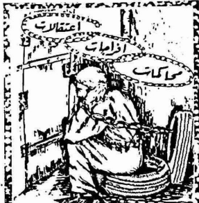
رفض السماح لزيارة اهالي المعتقلين في سجن الخليل