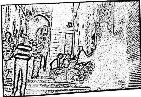
مكنا شردت عائلة الكركي من بيتها في البلدة القديمة بالقدس، وهكذا كان مصير عشرات العائلات التي اخليت بأساليب مشابهة.