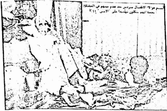
عائلة من الجفثك بعد هدم البراكية التي كانت تعيش فيها. شمل عدة من البراكيات - وسياسة هدم البيوت تكرر بذرائع مختلفة.