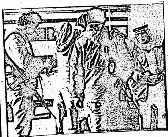
الى الاعلى : مشهد مألوف في المناطق المحتلة، حيث يتم انزال المواطنين من الباصات لتفتيشهم على الحواجز. الى اليسار : شبان فلسطينيون يعبرون من احتجاجهم بحرق اطارات الكاوتشوك.