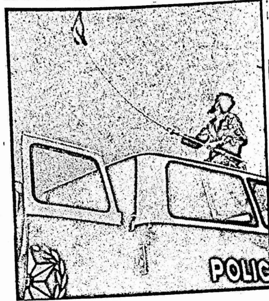
يتعكس تمسك جماهير المناطق المحتلة بالهوية وبالذولة الوطنية المستقلة برقع الاعلام الفلسطينية، في المناسبات الوطنية.