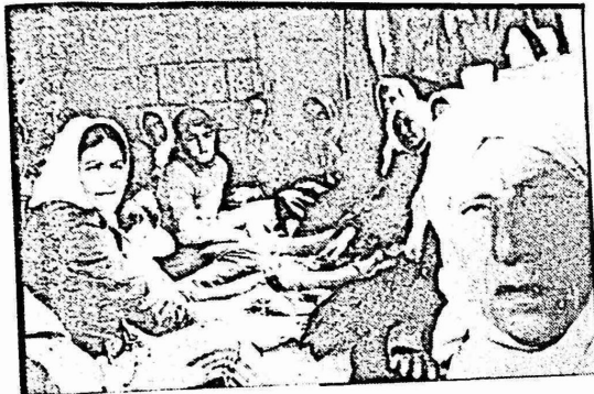
واحد من الاعتصامات النسائية الكثيرة التي تشهدها المناطق المحتلة تضامنا مع المعتقلين الذين تسوء اوضاعهم في المعتقلات الاسرائيلية.