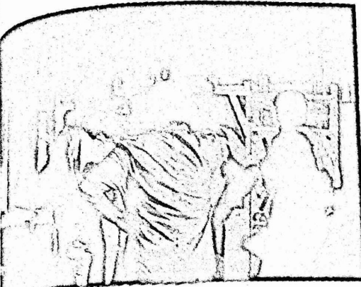
عضوا الوفد يقدمان الشرح حول معرض الملصقات بمناسبة يوم ٧٠ عاما على ثورة اكتوبر الذي اقامه الوفد في ساحة المخيم

غاية السعادة ، حيث يسود النخيل من الصداقة الحقيقية ، وبشر الانسان هنا بالانطلاق والتغيير ذاته في هذا التجمع الاخرى البار