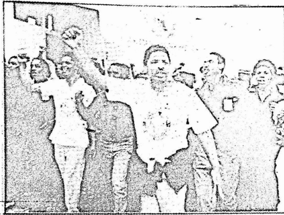
عمال المناجم في احدى مظاهرات التأييد لقادتهم

فيما يستعد عمال المناجم الافارقة لاستئناف معركة الاجور والحقوق الاخرى، يسود الهدوء في المناجم ويعود عشرات الاف العمال لاستئناف العمل. وكان ممثلو اتحاد نقابات عمال المناجم قد وافقوا على انتهاء الاضراب الذي دام ٢٦ يوما في اعنف مواجهة واطولها واكثرها كلفة شهدتها جنوب افريقيا. وهكذا انزلت شعارات الاضراب التي اعتلت مداخل المناجم، وتوقف العمال عن انشاد النشيد العالمي "كل الالات تتوقف اذا شاءت يدك القويتان". فيما ترتفع في سماء جنوب افريقيا كلمات النشيد العالمي الوطني الذي كتبه الشاعر "بنجامين مولويز" ومطلعه يقول "المجد للشعب المقاتل" وقبل صعوده الى جبل المشنقة.