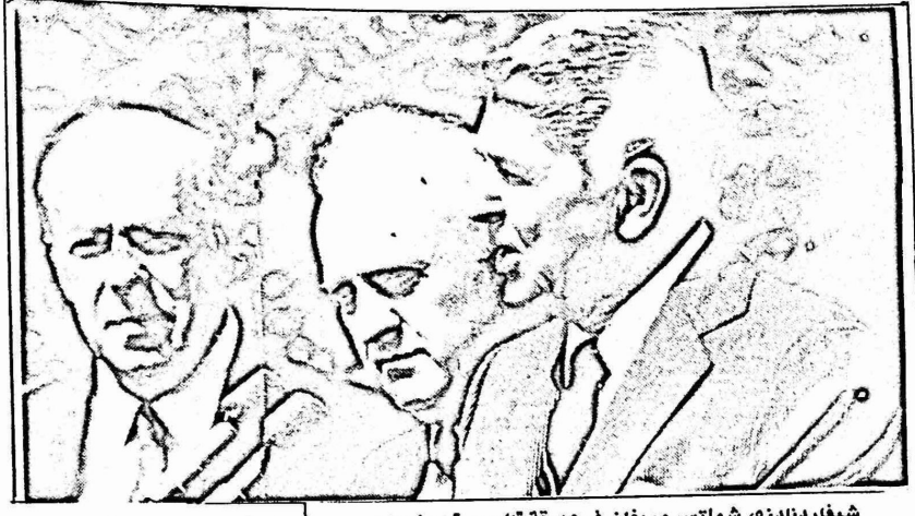
شيفاردنازده، شولتس وريغان في حديقة "الورود" بواشنطن

اتفقت اراء السياسيين والمحللين ووسائل الاعلام في الشرق والغرب ، على ان الاتفاق السوفياتي الاميركي حول الصواريخ متوسطة وقصيرة المدى ، بشر بعصر جديد من الانفراج الدولي ، وشكل خطوة هامة نحو نزع السلاح النووي ، وعزز امل شعوب العالم النامي بقرب اطفاء بؤر التوتر ، التي تودي في المقام الاول بابنائها وتدمر اقتصادها ، وكذلك بعلاج الازمات المستحكمة مثل التخلف في التنمية والديون .. وغيرها.