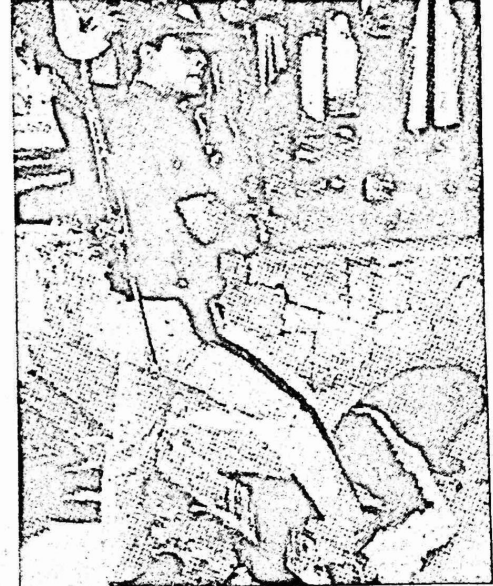
يعتبر هذا من المناظر المألوفة عن مجاز النظام العنصري في السلفادور - يظهر في هذه الصورة التي وزعتها وكالة "سوشفيتدبرسي" ، احد افراد قوات الامن وهو يدوس برجله احد المواطنين الذي ارداه قتيلاً برصاص مدمس مقابل السفارة الاميركية في العاصمة سان سلفادور .