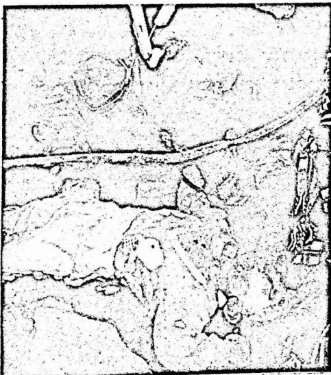
فن الطيران الحربي الاميركي عدواننا واسعاً على الاحياء السكنية في العاصمة الليبية، مما ادى الى مصرع عشرات الاطفال والعزل . وذلك بحجة "مكافحة الارهاب" .