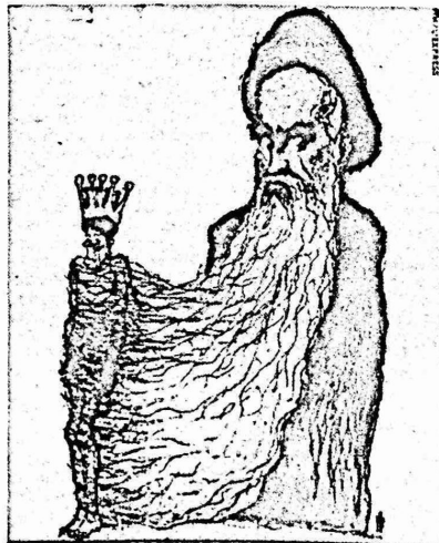
كانت كل خطابه موجّهة ضد "الشیطان الأكبر" ، الذي تبين انه يختفي في لحيته . كشف المفضحة المسماه "ايران - كورترا - غيت" .