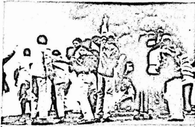
رغم فرض الاحكام العرفية في جنوب افريقيا العنصرية منذ خمسة اشهر ، واعتقال ٢٣ الف مواطن تصفهم من الاطفال الا ان جذوة النضال الوطني الافريقي لم تهدأ ، وتساعد الغضب الشعبي ضد العنصريين وحماهم الامبرياليين .