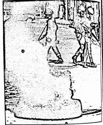
لم تظلم القضية الحديدية الاسرائيلية ولا ارواح "التنمية" الأردنية في خداع امالي المناطق المحتلة . وتواصلت على انفراد العام المظاهرات واعمال الاحتجاج التي بلغت ذروتها في كانون الاول ، واستشهد اربعة شبان وجرح خمسون آخرين .