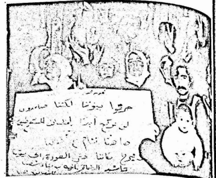
بعد تطان الفاشيين ارمابهم ضدالمواطنين العرب في البلدة القديمة القدس ، ويظهر في الصورة بعض ابناء عقبة الخالدية الذين شردوا بعد نقل ستوطن اسرائيلي .