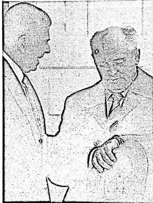
تفصلنا ساعات معدودة عن انتهاء العام الدولي للسلام . وريغان يضع الفرص التاريخية التي سنحت في قمة ريكيافيك لتخليص البحرية من كوارث الحروب النووية .