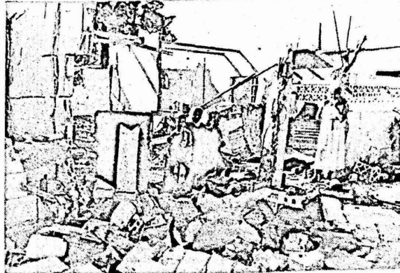
واصلت حركة "امل" حصارها للمخيمات الفلسطينية وقصفها . وقد استشهد جراحاً هذا القصف ٢٥٠ فلسطينياً وجرح ٨٠٠ ، منذ ٣٠ ايلول الماضي لقط .