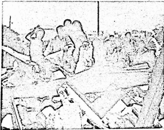
استمرت السلطات الاسرائيلية في تطبيق العقوبات الجماعية ومن ابرزها هدم البيوت ، وفي الاسبوعين الاخيرين هدمت السلطات واغلقت ١٤ منزلاً ، بالإضافة الى مسجد .