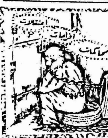
ادارة سجن بشر السبع تقتحم غرف المعتقلين

اصدرت السلطات الإسرائيلية . في بيت ايل . الخميس الماضي (٧/١٩) . يقضي بمنع توزيع صحيفة "الضفة" بالضفة الغربية والقطاع غزة . لثلاثة ايام . احتجارا من يوم الجمعة وحتى صباح الاثنين الماضي . وجاء اجراء السلطة هذا . بعد ان الصحفية نشرت مواد افشحت القريبه العسكري "بمس الاس والسطح العامة" .