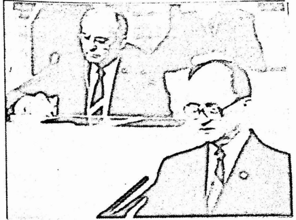
القائد البولوني باروزلسكي يعلن افتتاح المؤتمر العاشر للحزب . ويظهر خلفه ميخائيل غورباتشوف .

وقال باروزلسكي : "ان بولونيا تعبر اهمية كبيرة الى بلدان حركة عدم الانحياز . وتتضمن مع النضال ضد العنصرية والابرتهايد وجميع اشكال التمييز ، وازداد باروزلسكي قانلا : "ان العلاقات مع البلدان النامية تحتل مكانة اكبر فاكبر في سياستنا الخارجية، ونحن نؤيد طموحات بلدان آسيا وافريقيا وامريكا اللاتينية الى بلوغ حل عادل لاهم القضايا الكونية ، ونطالب باجرا" تسوية عاديه لمشكلة الديون التي تخضع عشرات الدول النامية . واعلن باروزلسكي ان حزب العمال البولوني الموحد يؤكد تصميمه على العمل دوما على تعزيز الصلات الشاملة والتعاون مع الحزب الشيوعي السوفيتي والاحزاب الفيقية الاخرى . ونحن الى جانب تعزيز جيروت الاسرة الاشتراكية وزيادة تلاحمها في كافة المجالات .