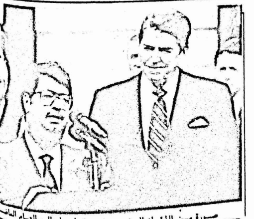
صورة من اللقاء الذي جمع ريفان واوزال، العام الماضي ويعدى اوزال بان جميع المعتقلين السياسيين في تركيا وعددهم ١٥ الف معتقل، من بينهم قادة الحركة القاعدية، هم جميعاً من "الارهابيين" [! هذا ومن بين القيد المفروضة على الحياة السياسية في تركيا والتي تشير الى مدى حركتها، القرار الصادر عن وزراء ما ساهل من بولات وسلهمان ديميرل وبختر علياى باى تصريحات سياسية ١٩٩٢

اصدرت الجمعية العلمية المتحدة تقريرا عن الازمات في العالم اشارت فيه الى ان الكبر الذي شهدته كوريا هذا البيان فانه بعد ٢١ عامًا نجاح الثورة الكورية فان نسبة بين الاطفال في كوريا هي ١٥٠ وهي من ادنى النسب في العالم وان متوسط عمر الانسان لها (سنه) وهو اعلى النسب في العالم