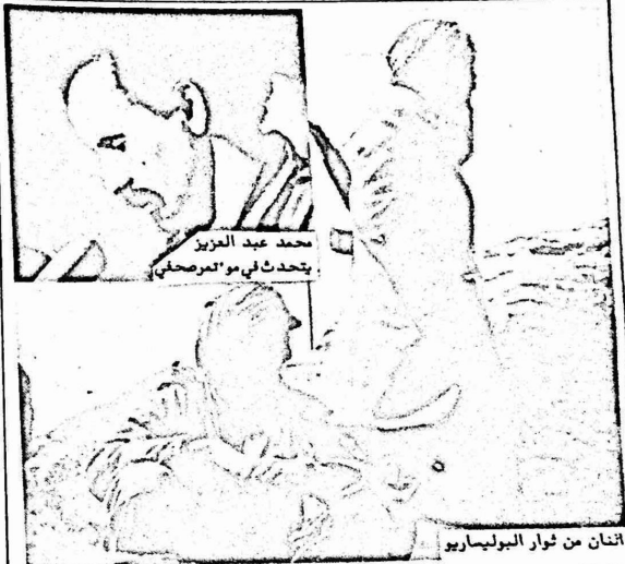
انسان من ثوار البوليساريو يتحدث في مؤتمر صحفي.

سولون في الجبهة "ان الدعم اللبيني تولد في الواقع عام ١٩٨٢". ودعم اميركي - اسرائيلي