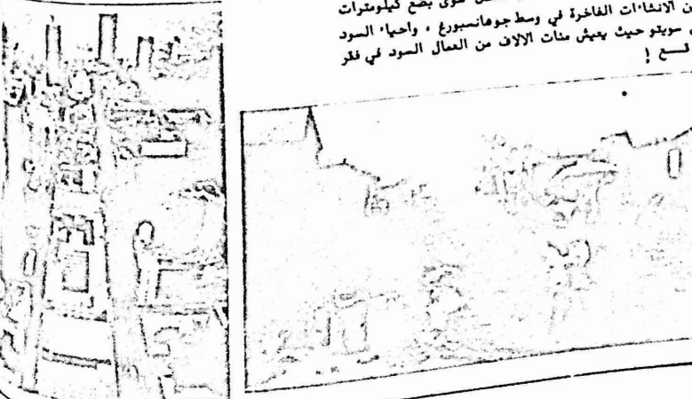
لا تفصل سوى بضعة كيلومترات بين الانشآت الفاخرة في وسط جوهانسبورغ . واحياء السود في سويتو حيث يعيش مئات الاف من العمال السود في فقر مدسح !