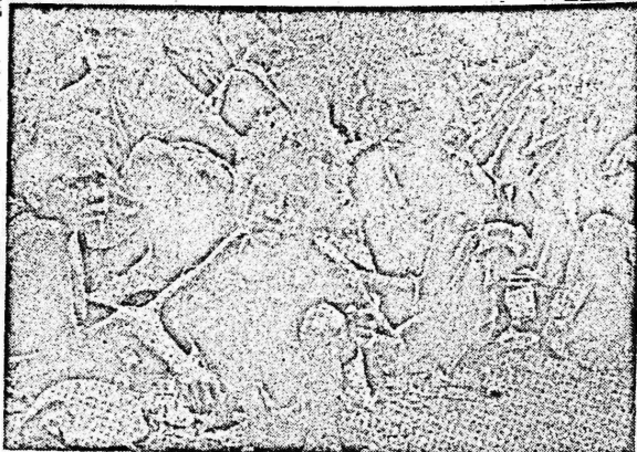
هذه هي بصمات الاحتكارات الامبريالية على شعوب الدول النامية

في الولايات المتحدة، و ٨٠ مليون دولار في بنا، مصنع جديد للشاحنات هناك، وتخطط لاستثمار ٤٤ الف مليون بيسيتا في اسبانيا، وقد سحرت ٢٠ الف عامل في فرنسا في عام ١٩٨٥، وهي تخطط لطرد تسعة الاف آخرين في عام ١٩٨٦. وقد سحرت ٤٦٠٠ عامل في الولايات المتحدة وهي تهدد بنسف المصير ١٨٠٠ عامل في صناعة الشاحنات. وسوف تطرد ٢٥٠٠ عامل في اسبانيا. حصلت على اقلية اسهم شركة رانوسي في ايطاليا،