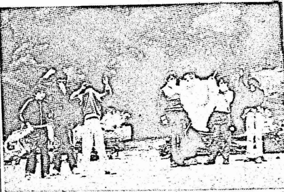
كبروا ويشيوا على الطريق الذى يحاول الدكتاتور خرفهم فيه..

التقد الدولي. اما عن مظاهر الازمة الاخرى فقد بلغت نسبة التضخم للعام الحالي ٢٦٥ بالمئة، ووصل معدل البطالة الى ٢٠ بالمئة كما وصلت الديون الخارجية الى ٢٤ مليار دولار. كما ارتفعت الاسعار بنسبة ٤٠ بالمئة. وفي نهاية العام الماضي تم اخلاق ٩٢ صنعا كبيرا. وارتفعت الفتلقات المكرسة للامن والدفاع الى اكثر من ٤٢ بالمئة من الموازنة العامة. هذا واعادت الحكومة تسليم نتائج النصار الى الشركات الاحتكارية