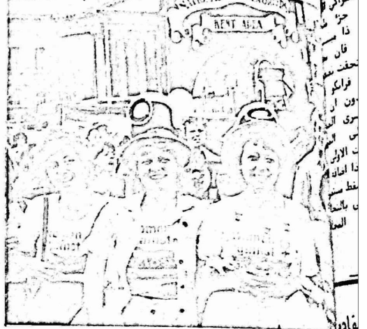
عمال المناجم ايضا يشاركون في المظاهرات