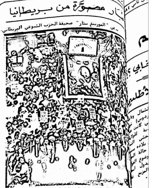
المظاهرات العمالية الضخمة انتصارا لنضال عمال المناجم وفي طليعتها القادة النقابيين

في فضيحة اخرى من فضائح ال (سي آي ايه) ويبدو ان هذا فصل فضائح التي اخذت تعذفها الحملات الانتخابية في الولايات المتحدة . كشف تقرير قام باعداده ديفيد وايزمان من جامعة هارفارد مؤخرا تحت عنوان "الصحافة وقنبلة النيوترون" ان ادارة الرئيس الاميركي السابق كارتر اوعزت الى ال (سي آي ايه) ان تقوم بوضع برنامج سرى في اوائل عام ١٩٧٨ لاستمالة واستقطاب الصحافة الأوروبية لتكتب تقارير صحفية ذات توجه ايجابي فيما يتعلق بالاسلحة النيوترونية ولتقوم بتوجيه الانتقادات الى الجهود السوفيتية الداعية لوقف انتشار هذه الاسلحة وتوزيعها ، وذلك بتقديم الرشاوي المالية للصحفيين والمؤسسات الصحفية الاجنبية وقد اعترف احد مسؤولي ادارة كارتر الذي شارك في التخطيط والاعداد لهذا البرنامج بصدقة هذه المعلومات . ويذكر التقرير ايضا ان ال (سي آي ايه) قامت في سنوات الخمسينات والستينات ايضا باستخدام صحفيين اميركيين واجانب كعلاخ لجمع المعلومات وكتابة التقارير الصحفية توزع هي بها وبافكارها ونشرها في وسائل الاعلام العالمية كما وقدمت (السي آي ايه) في معظم الاحيان مبالغ مالية مقابل ذلك . هذا وقد صرح مسؤول سابق في الكونغرس الاميركي وكان من