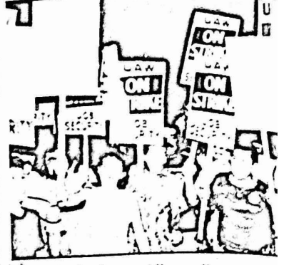
البريد الذين تجاسروا واحتجوا

بالعيد الوطني الأمريكي "يوم العمل" في نيويورك في الشارع الخامس (فيفت أفينيو) وكان احتفال للغاية وخلا الشارع الرئيسي من الجمهور، وعلقت تايمز على ذلك في افتتاحيتها في اليوم التالي دور الحركة النقابية "أما ج. كرافت، مراقب صحفية يقول: فانون يرغمهم على استئناف العمل بل ويحظر أية حركة إضرابية خلال السنتين التاليتين، وذلك بإيماز من البيت الأبيض. واليوم تهدد إدارة ريفان بغرض عقوبات صارمة على عمال