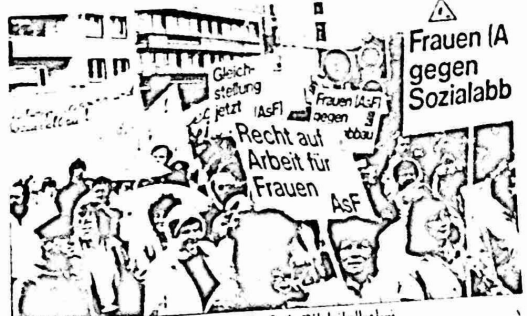
ساعة ألمانيا الاتحادية يطالبن بحقوقهن في العمل

تقول دراسة مصادرة أجراها اتحاد النقابات الأوروبية ان العاطلين في أوروبا الغربية يزيد عددهم عما سجله الإحصاءات الرسمية. ووفقا لما توصل اليه الدرس اجروا تلك الدراسة فان هناك ما لا يقل عن ١٩ مليون عاطل عن العمل. وهذه الجمعة المتفجرة ناجمة عن السياسات الليبرالية الجديدة وعن دليل ايضا على المعاصم التي تواجهها المنظمات الإحصائية في اتحاد النقابات الأوروبية في وضع استراتيجيتها مقبلا وجاهة.