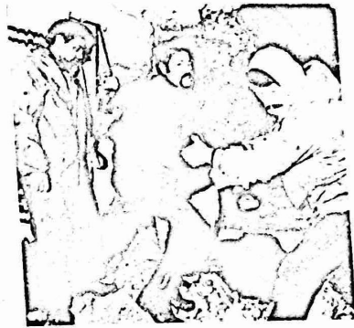
مائة الشتاء الماضي هل تتكرر؟