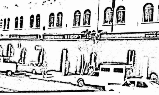
الباصات من هذا الموقع الى موقع الباصات لوكالة الفوت الواقع قرب آخر في حي المصراه . . . وانه

باب الاساط فان البلدية لا علاقة لها بهذا المركز الذي كان موضوع بحث بين وكالة الفوت وادارة الأوقاف قبل عام ١٩٦٧ وقد خصصت لجنة اعمار المسجد الاقصى آنذاك مبلغ ثلاثا لآلاف دينار دفعتها للوكالة في حسنة للعمل على نقل الموقع الحالي من باب الاساط الى مكان آخر وذلك لتأثير هذا الموقع على مدخل باب الاساط المؤدى الى المسجد الاقصى المبارك . وقد حرت عدة اتصالات بين المسؤولين في الأوقاف ووكالة الفوت . ولم تكن هناك اي علاقة للبلدية بهذا الشأن وقد اعد قسم الهندسة في الأوقاف الاسلامية المخططات اللازمة لاضافة المساحة المقام عليها "مركز التوزيع التابع للوكالة الى موقف السيارات القائم والتابع للأوقاف وتنظيم الموقع بشكل يتناسب مع قدسية