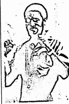
موريس بيشر سوب

بينما تتحدث مصادر الادارة الامريكية عما تصفه بتأييد سكان جزيرة غرينادا للغزو الامريكي ومطالبتهم بضم الجزيرة الى الولايات المتحدة، تحدثت وسائل الاعلام المكسيكية عن واقع مأساوي واشارت الى استخدام القوات الامريكية الغازية للاسلحة الكيماوية لمقاومة سكان الجزيرة. وقالت الصحف المكسيكية ان الغاز الامريكي المستخدم قد ادى الى اصابة عدد كبير من المواطنين بشلل الاعصاب كما انه قد اودى بحياة حوالي 3000 من الغريناديين. وافادت وكالات الانباء بان الولايات المتحدة تحاول اخفاء حقيقة ما يجري في غرينادا ولا تزال تمنع وصول الصحفيين ومراسلي وكالات الانباء والشبكات التلفزيونية الى هذه الجزيرة الصغيرة ومن ناحية اخرى ذكرت مجلة "نيو انديا" الهندية الاسبوعية ان المخابرات المركزية الامريكية بامر من البيت الابيض. وتشر معلومات مطلية عدد من البلدان في الامم المتحدة الى ان وكالة المخابرات المركزية قامت بنشاط تخريبي فعال في غرينادا قبل حوالي سنة من غزو القوات الامريكية لها، وكان يشوب قد حذر مرارا من خطر التدخل الامريكي وقالت المجلة الهندية بان الوكالة المذكورة قد تمكنت من تجنيد المدعو "سيفس سيلوم" قائد الحرس الخاص لرئيس الوزراء المنذور لتنفيذ عملية الاغتيال حيث اطلق النار على "بيشوب" وبعدها تم القضاء على القاتل فوراً.