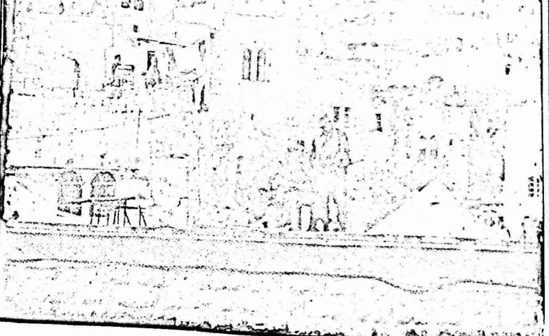
وانحاضات على الاسئلة، على ان الجهد السرد من الحسد وذلك عبر مناطق سكاكهم. اضاذة لتخطيط السلطات لنقل الامير الحسنة الى ساحد مدرسة الامير محمد وموتف الناجات الى ساحد معلم الطوب ؟!