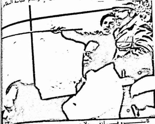
كانت روكي انغولا :

وكانت الولايات المتحدة قد تبنت مطالب النظام العنصري