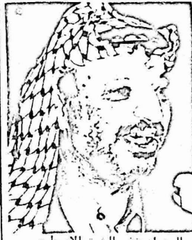
العدوانية في الشرق الاوسط

اكد الرئيس الفلسطيني ياسر عرفات، استحالة التوصل الى تسوية عادلة في الشرق الاوسط ما لم يتم تحقيق حقوق الشعب الفلسطيني العادلة. واصل عرفات، الذي كان يتحدث مع مراسل صحيفة يو.ا.س نودى، بان تجاهل الولايات المتحدة لحقوق الشعب الفلسطيني يهدد الى طمس نصته وسله حقوقه المشروعة. وقال بان تقديم الولايات المتحدة للمساعدات العسكرية الى اسرائيل هو جزء من سياستها