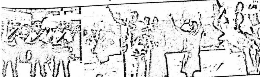
يظهر في الصورة رقم (١) ، الاطفال في جنوب افريقيا في مواجهة سيارات البوليس العنصري المخصصة لمكافة "الاصطرابات" ، وذلك خلال نشع حنارة احد القاسين السود الذي قتل خلال صدام مع البوليس . وفي الصورة رقم (٢) ، شرطة القمع العنصرية في مواجهة احدي المنايات في جوهانسبرغ ، حيث تقع مكاتب اللجنة الديموقراطية للوحدة، ومجلس الكنائس في جنوب افريقيا ، وسطما تقدمه اخرى .