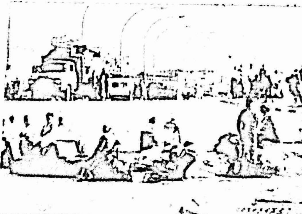
عمليات الاخلاء والطرود القسرية في جنوب افريقيا تؤدي الى تشريد عشرات الالف المواطنين كل يوم .