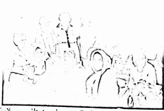
جانب من الاعتصام الذي نظمته عائلات المعتقلين في مقر الصليب الاحمر بنابلس

من مديرية السجن العامة والتي تصرف قبل ان نقل الى المعتقل الجديد، الذي اقيمت سلكات الاجتلال العمل فيه مثلما تمنع ويطلب اليه المعتقل من سجناء من السجن وغيره من السجن. ان الوضع في سجن نابلس المركزي هو محذر الصفا في عرف معتز صااحبها معه اضرار مرعبة لا يسع لاكم من اربعة اشهر وحيث يكون فيها احيانا ٨ اشهر اما سجونها فمكوبه من نلات طبقات مما يجعل عمله النهونه والسفس في العرف صعب جدا.