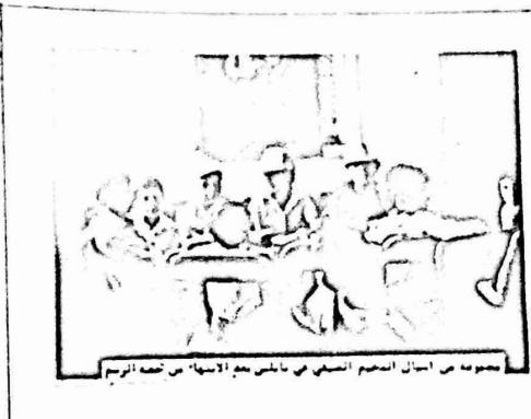
مجموعة من اطفال المرحم الصغرى في باليت مع الاسماء في تصف الرسم