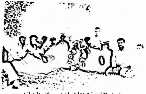
اصحاب الاراضي - هذه ارضنا وحسب ماون طلبنا

مارس املاك الغائبين يبلغ الحاضرين بمصادرة اراضيهم !!