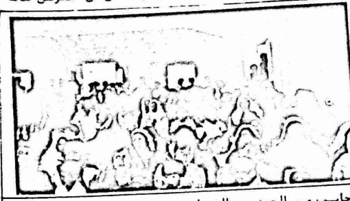
حالت من الجمهور الذي احسد في مجمع الطسبه ..

وفي القدس اجتمعت سناه الفاطس في المدارس الخاصه يوم الجمعه الماضي ٨٤/٨/١٠ محم الاسال الاول الذي اسمر حسمه اسابع مسرحان من خاند امامه خلال رحله الى ماما سارك بها الاطفال واحالهم واصدائهم . وقد لخلل المهرجان كلمه لاحدى عصوات الهيئه الاداريه للفنايه واحرى لاصن سرها وقغراب سنه مسوعه لغرد المحسم "صرا وتاسلا" "الوحدان" و "فلندا" ... كما رسم في سنها المهرجان تكرم المصطوعين من خارج النفايه لجهدهم التي بذلوها والتي كان لها الاثر الاكبر في نجاح المحسم . هذا وكاتب النفايه قد افتسحت في مركز الارشاد الفلسطيني يوم الخميس الماضي ٨٤/٨/٩ معرض اشمال ورسومات اطفال المحسم التي اشتملت على رسومات فنيه مختلفه واشغال يدويه وحاسبات واعمال جس . وقد تميزت المعروضات بالبساطه والانفان وكشفت عن مواهب دقيقه لدى طفلنا الفلسطيني ، الذي يحتاج الى مثل هذه المراكز والمخيمات لتطويرها ورعايتها . وقد امّ المعرض العديد من المؤاسات الوطنيه والنقابات واللجان الجماهيرية ، والذين اجمعوا على ان المخيم بالرغم من باطئته وتواضعه .. فهو بادرة ايجابية يجب ان تشمل كافة