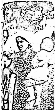
التطبيع الى اقامة شركات خيطا لبنانية - اسرائيلية.

الزراعي مثل الفواكه والحاصل الى خراب كبير. وما يزيد من هذه الهزيمة ان اللجنة الاقتصادية شكلتها الدولة اللبنانية لم توضع العلاقات الاقتصادية لبنان وإسرائيل قد تحلت بعد ان تبين ان اكثر من هذه اللجنة قد خدروا من التطبيع مع إسرائيل، خدروا من إمكانية ان يودوا